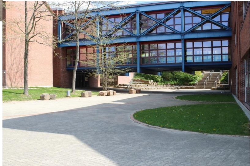
... und unsere „Brücke“, die beide Gebäudeteile miteinander verbindet.