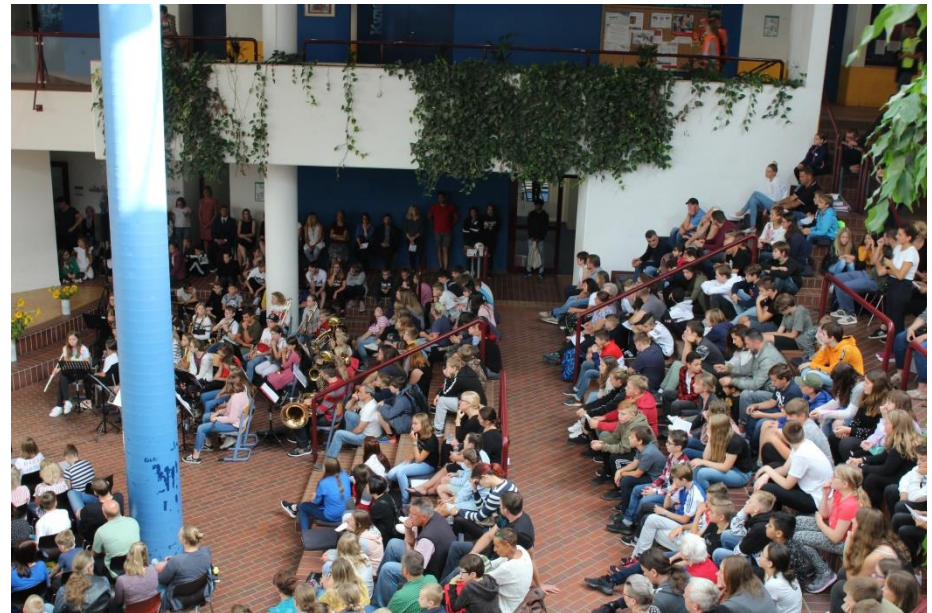
lichtdurchflutetem Forum, das über alle drei Etagen geht und in dem viele unserer Veranstaltungen stattfinden!