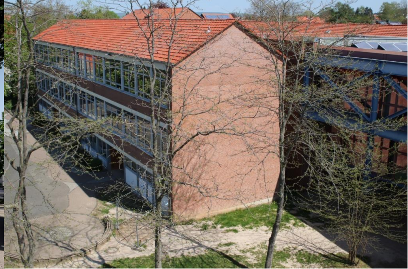
unser „Altbau“ – mit den Klassenräumen für die Jahrgänge 7 -10...