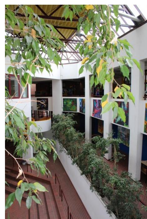
Unser Eingangsfoyer mit unserem...