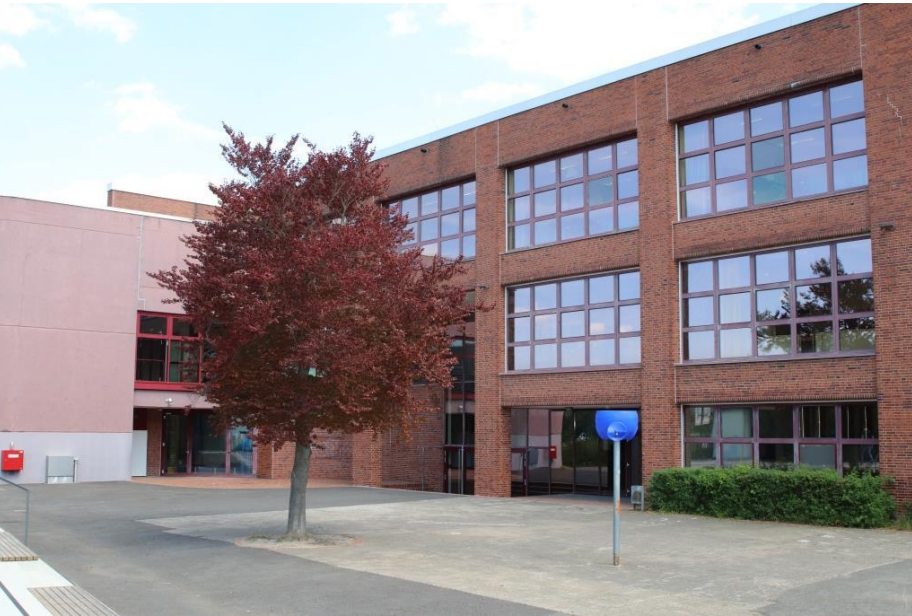
unser „Neubau“ – mit der Bushaltestelle direkt vor der Tür...